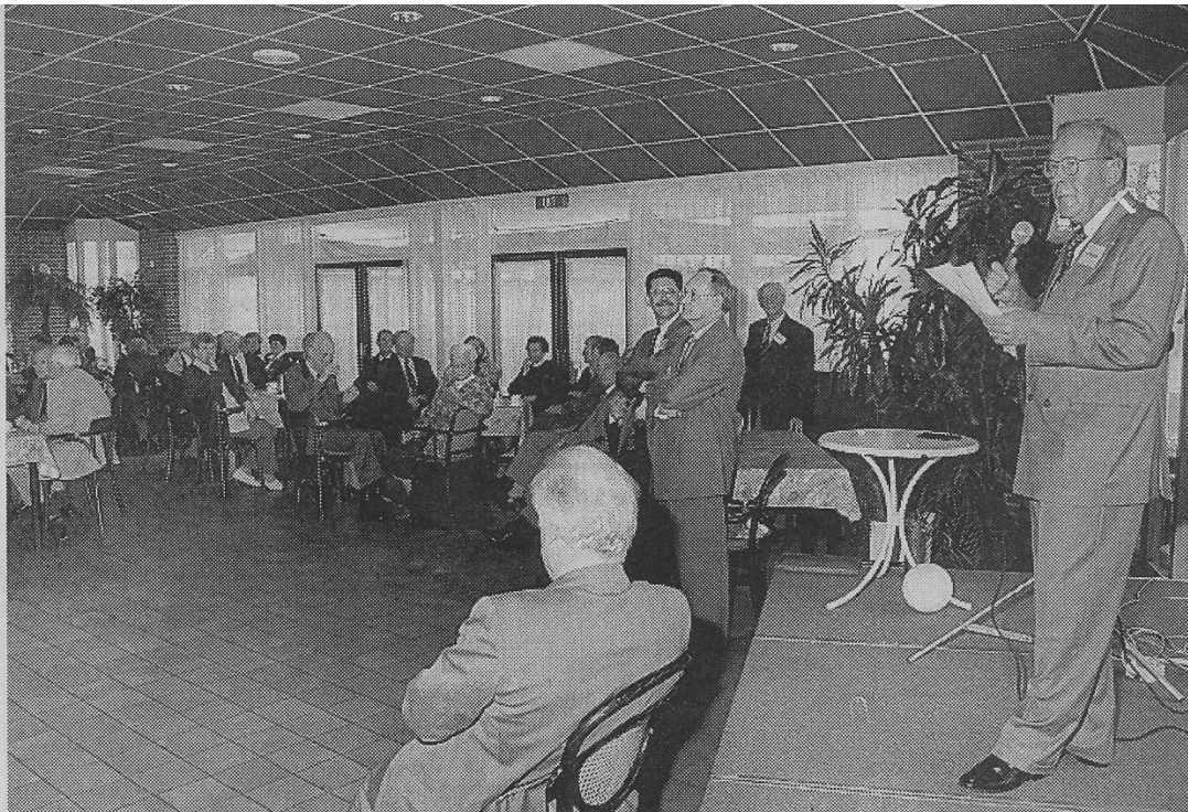
Voorzitter Schreiner: "Op naar de halve eeuw." De receptie van de jubilerende Harttrimclub genoot een grote opkomst.